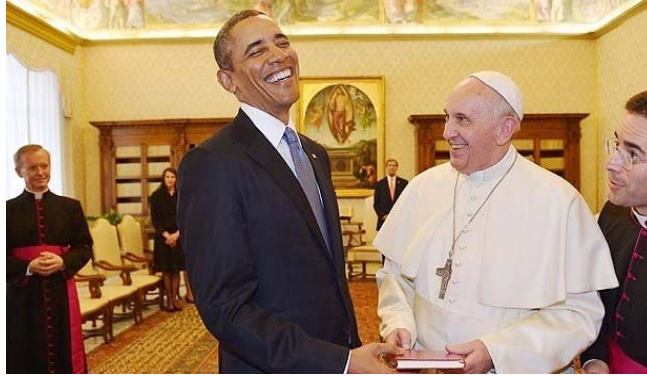
Visita del Presidente Obama a SS. Francisco, el jueves, 27 de marzo de 2014

En el reciente encuentro que tuviste con el Presidente Obama, se hizo evidente algo que ya sabíamos, que te tiene mucho «respeto» desde la vigilia de ayuno y oración que animaste desde Plaza San Pedro para toda la Iglesia, por la paz en Siria. Con ella concientizaste a la opinión pública mundial y así le desbarataste a Obama el plan ya inminente de invadir Siria. Me dio gusto escuchar sus declaraciones después del encuentro contigo: que te admiraba por tu liderazgo a nivel mundial y porque tienes la capacidad de abrirle los ojos a la gente para vea con objetividad las realidades del mundo y porque logras involucrarla para ir resolviendo situaciones difíciles. En este encuentro vi dos líderes mundiales en notable contraste: el Señor de la guerra que tiene todas las armas imaginables y