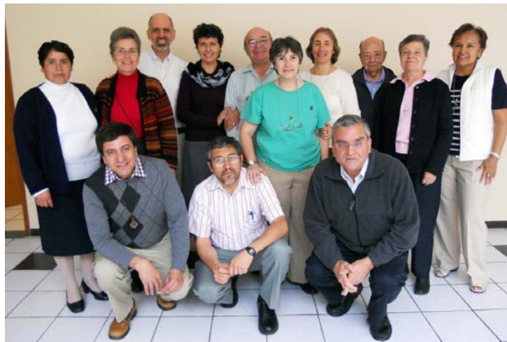
Junta Directiva Nacional 2011-2014