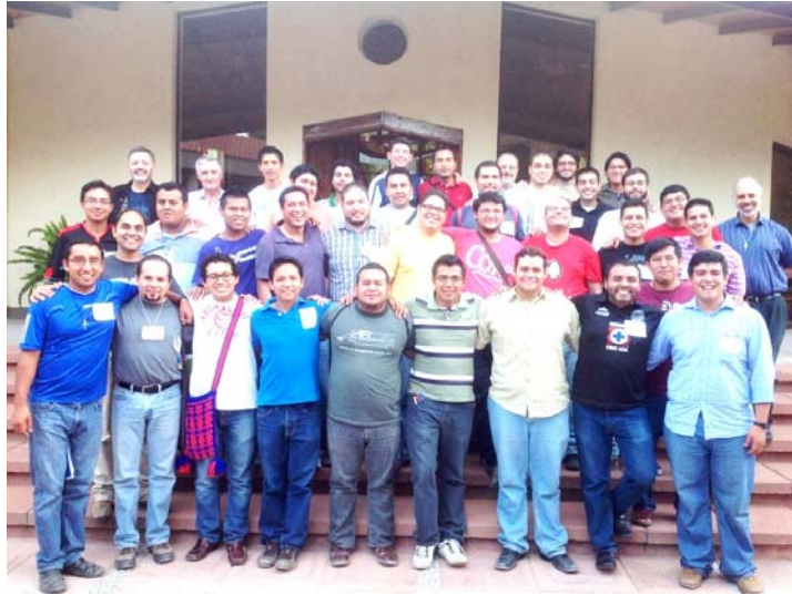
Hermanos Formandos y Padres del Consejo General

Agradecemos a Dios su presencia en esta historia congregacional, en las personas que se la han jugado por el proyecto del Reino en este carisma específico, y las mediaciones que Dios va poniendo para comunicarse en la historia.