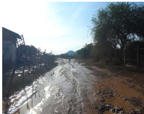
Comunidad de la Cuchilla, Municipio de Altamirano, Guerrero