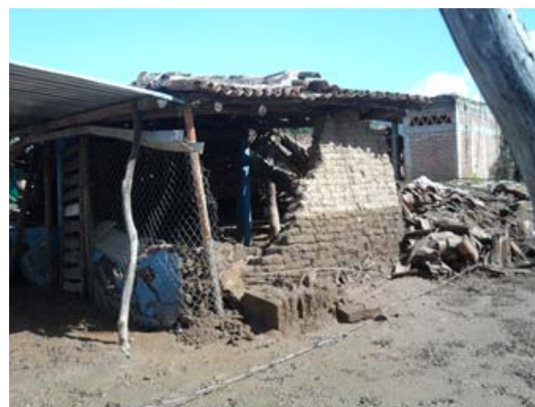
Comunidad de San Pedrito, Municipio de Altamirano, Guerrero