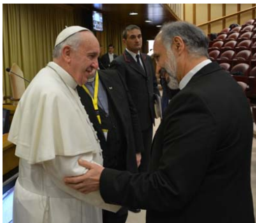
S.S. Francisco y P. Fernando Torre, MSPS

Salimos contentos, agradecidos. Ese encuentro fue un estímulo para seguir realizando la misión pastoral que Dios Padre nos ha confiado en favor de nuestras respectivas congregaciones. «Así, hasta ganas me dan de ser católico», comentó en broma uno de los participantes. Pero, bromas aparte, mucha gente se está acercando o volviendo a la Iglesia por el «efecto