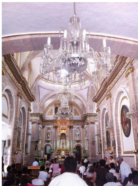
Interior del santuario