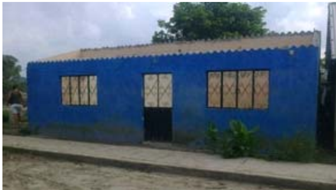
Con cariño, lo que queda de la casa azul.

Por mí ya no se puede hacer nada, ni reconstruirme, ni reubicarme, sólo demolerme; pero sí hay viviendas que puedes ayudar con tu granito de arena. Te pido nos apoyes con tu aportación para impulsar acciones solidarias y poner 200 pisos firmes en el municipio de San Rafael.