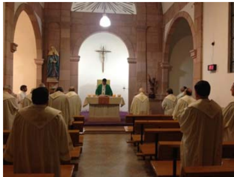
Eucaristía en la Capilla de Jesús María

«Revitalizar nuestra experiencia de Dios, para que nuestro estilo de vida personal y comunitario sea transparencia de radicalidad evangélica en el modo pobre de vivir, en la solidaridad con los que sufren y en la audacia de situarnos proféticamente en la Iglesia y la sociedad» [...].