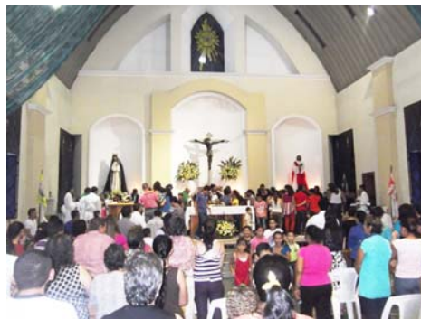
Parroquia del Santo Cristo de Esquipulas, en Guastatoya