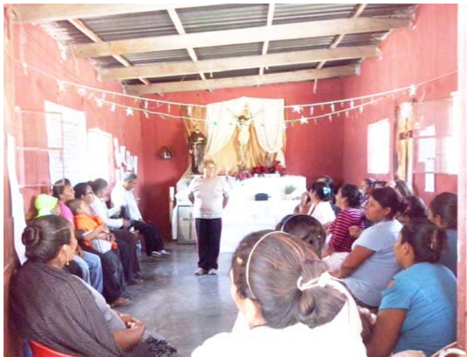
Capilla de La Pólvara, Pozas de Santa Ana

Por último, les compartimos que la experiencia pastoral de la comunidad es intensa, ya que la parroquia es bastante amplia, debido a que tiene a su cargo 49 comunidades, en las que se trabaja como prioridad lo sacramental y la evangelización, pero también, poder estar atentos en los procesos de catequesis, de aspectos de solidaridad, de formación espiritual y desde luego, de acompañar a la gente en sus alegrías, así como en sus enfermedades y muerte. También se atiende en varios ranchos la pastoral juvenil, teniendo ésta muy buena respuesta, la cual, se convierte en una inversión económica, porque atenderlos implica gastar gasolina y no reditúa en nada, pero la parroquia apuesta por ofrecerles un espacio donde se encuentren con Dios y donde puedan potencializar su vida. La pastoral se convierte pues,