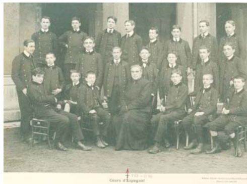
Curso de español, St. Chamond, 1912-1913