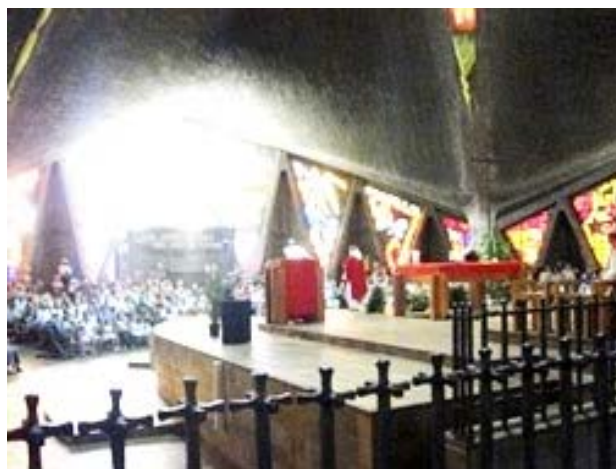
La Parroquia de Guadalupe, en Madrid