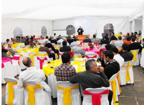
Comida en el Altílo

El Martes 16, por la tarde seguía el programa: a las 7.00 pm, en la Casa General se tuvo una celebración del centenario con el Nuncio Apostólico Mons. Christophe Pierre, donde participaron, el Consejo General y los tres Consejos provinciales; la homilía del Nuncio estuvo muy iluminadora, motivadora y bonita.