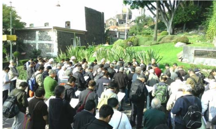
Oración en el Pocito, cerca de donde estuvo al Capilla de las Rosas

H ace más de un año, que se fijó el 15 de Diciembre como fecha del festejo Congregacional para dar gracias a Dios por estos 100 años de vida. Naturalmente muchos de los religiosos llamaron a la Casa General para dar su nombre y así tener un lugar seguro; el tiempo pasó y el Domingo 14 comenzamos a llegar a nuestro lugar de hospedaje: el Alttillo o la casa General; para la hora de la cena ya estábamos bastantes; ya se imaginarán los saludos y los abrazos y no tanto los abrazos, sino las «palmaditas» que muestran el afecto y el gusto de volvernos a ver, mientras son más fuertes y se oyen más, es más grande el afecto y el gusto del encuentro... Estábamos de todas las edades y de todas las generaciones que hablan del caminar durante este centenario, claro muchos nos acompañaron desde el cielo.... Hubo Apostólicos de Guadalajara, prepostulantes, postulantes, novicios, hermanos estudiantes y de ahí en adelante... El ambiente de la cena fue muy fraterno y de mucha alegría. Pronto nos fuimos a descansar, el día había sido de viaje y el día siguiente se esperaba muy «dinámico».... El Lunes 15, día tan esperado, nos encontramos en el comedor a las 7:45 am para