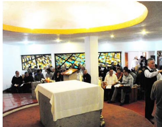
Cripta en el Altílo